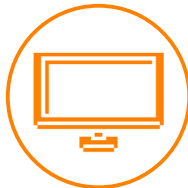
外部ディスプレイ